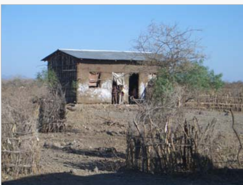
Eine Dorfschule in Dawe