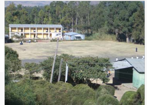
Die Akaki Schule. Hier werden unsere Kinder Tag und Nacht sehr gut betreut.

Die Bevölkerung – vor allem die junge Generation – braucht aber Schule und Ausbildung, um die weitere Entwicklung des Landes selbst mitzutragen und voran zu treiben. Genau hier möchten wir ansetzen. Die Ausbildung steht im Vordergrund. Hauptaugenmerk gilt der Nachhaltigkeit unserer Förderung. Wenn wir die Verantwortung für Kinder/ Jugendliche übernehmen, dann müssen wir einen Zeithorizont von Jahren kalkulieren.