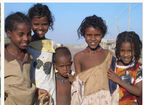
Diese Kinder brauchen unsere Unterstützung