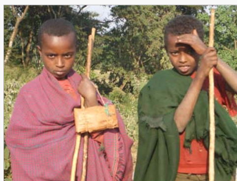
Kinder, die keine Schule besuchen können